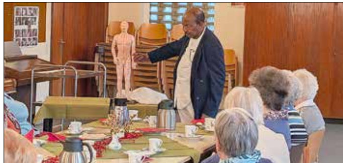
Text u. Foto: T. Hellmold

Ein gelungener Auftakt zum 1. Seniorennachmittag, an dem gut 20 Personen teilgenommen haben.